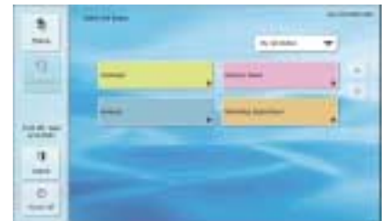
Écran de bouton de tâche

Plutôt que de conserver toutes les cartes de visite que l'on vous distribue, vous pouvez très facilement les numériser. Le ScanFront 220/220P traite plusieurs cartes à la fois et accepte même les cartes en relief.