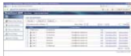
Menu Web Administrateur du ScanFront 220/220P

Bonne nouvelle pour les départements informatiques : la simplicité d'utilisation s'étend au processus de configuration. De nouveaux utilisateurs peuvent être créés à distance à partir du menu Web du ScanFront, l'attribution de leurs droits d'accès et d'utilisation ne prenant que quelques minutes. Le menu Web permet également à l'administrateur informatique de contrôler un parc entier de scanners ScanFront 220/220P via le réseau. La configuration de chaque ScanFront peut être sauvegardée et restaurée à distance.