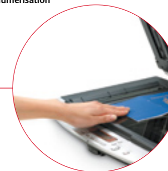
Numérisation à plat