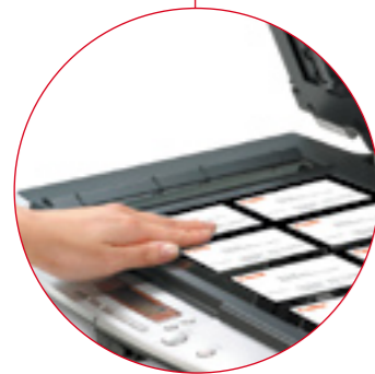
Numérisez jusqu'à 8 cartes de visite en un seul passage